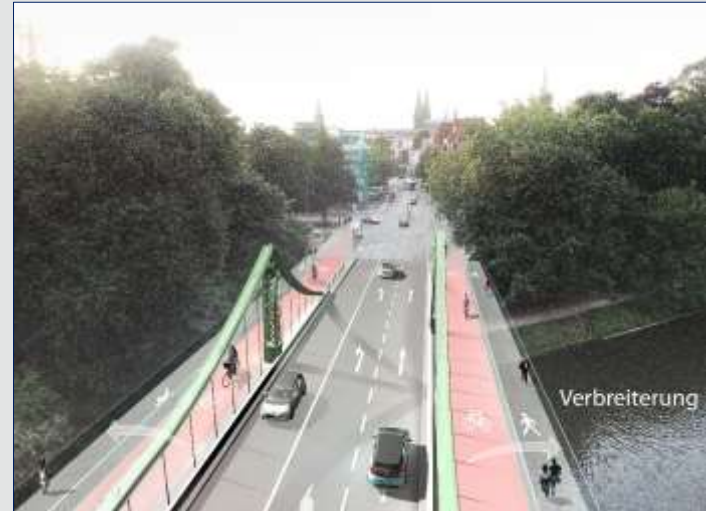
Visualisierung Grundinstandsetzung mit Verbreiterung